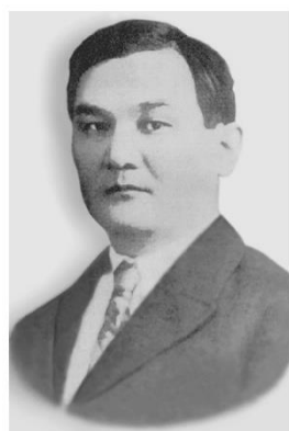
Нәзір Төреқұловтың жобасы